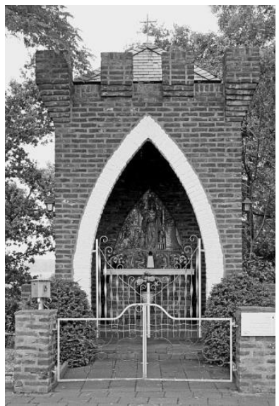
H. Barbarakapel Urmond

Barbara werd geboren als dochter van een heidense Romeinse edelman. Zij was een knappe verschijning. Op haar twintigste bekeerde zij zich tot het christendom. Haar vader was daar niet van op de hoogte en toen hij het ontdekte werd hij zo kwaad dat hij haar opsloot in een toren. Die liet hij voor dat doel bouwen. Er waren in de toren op verzoek van Barbara drie ramen gemaakt, verwijzend naar de heilige Drievuldigheid.